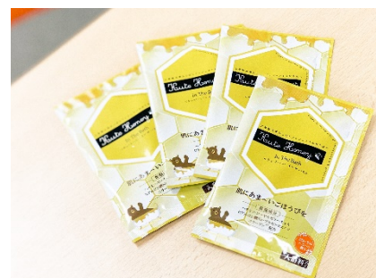
学生プロジェクトが製作したはちみつ入り入浴剤

特設サイト: https://www.kogakuin.ac.jp/omedeto/