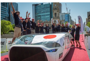
ゴールのアデレードで喜ぶ工学院大の学生の皆さん

私の好きな言葉は「情熱」。彼らは、情熱を持って全力で取り組む大切さを伝えてくれました。私自身も、誰もが夢や希望を持ち続けられる社会の実現を、目指してまいりたいと思います。