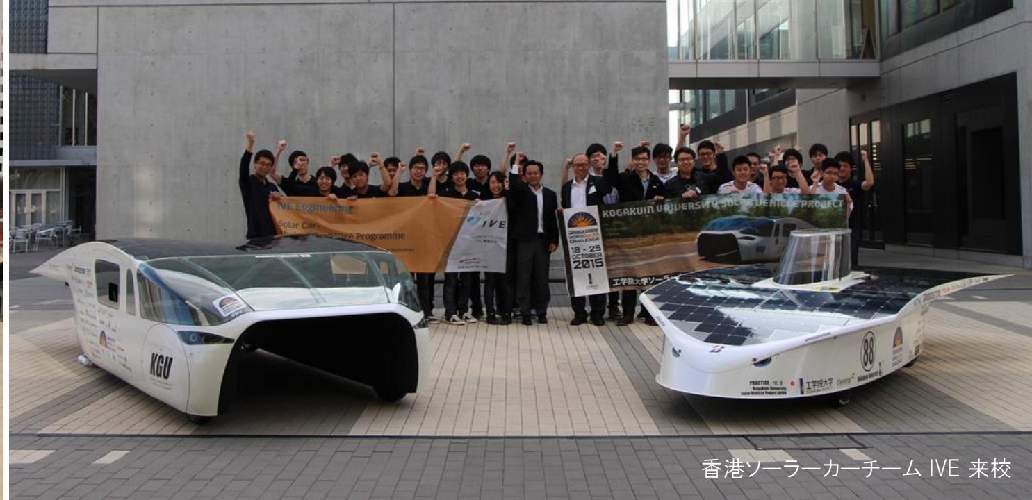
香港ソーラーカーチーム IVE 来校