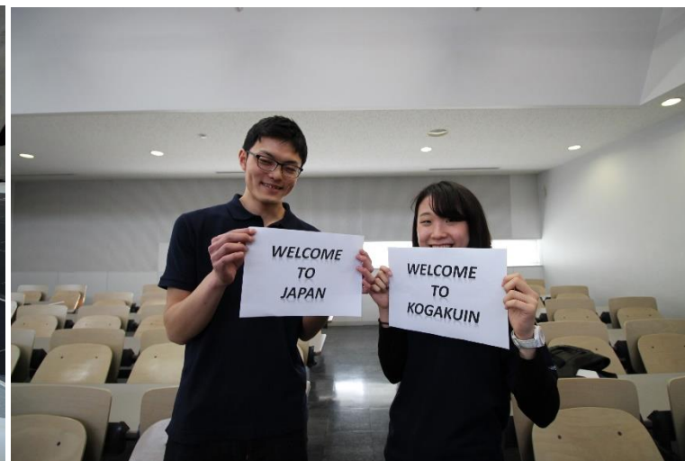
Technical exchange meeting