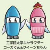
工学院大学キャラクター コーガくん&ワイオンちゃん