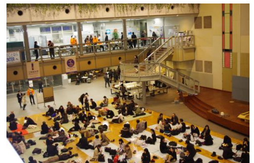
東日本大震災時はキャンパスに約700名の帰宅困難者を受け入れた

加えて、本学では2012年に新宿区と「防災・減災対策の相互連携に関する基本協定」および「帰宅困難者一時滞在施設の提供に関する協定」を締結しており、行政や地元住民、事業者等と連携し新宿駅周辺地域における災害時の情報拠点として西口現地本部および帰宅困難者の一時滞在施設として貢献しています。