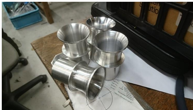
Fig.1 製作したファンネル

今月パワートレイン班では、エンジンのハンチングの解決のため、試験的にインテーク管径、管長、サージタンク形状、容量を変更したインテークを製作しました。