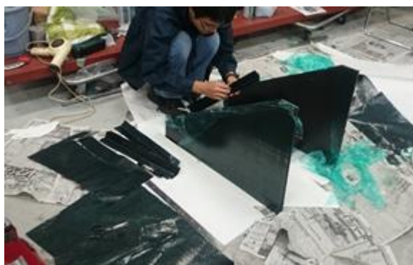
Fig. 2 フロントウィング中央部の CFRP 積層風景