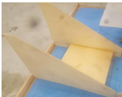
Fig. 1 CFRP 積層前のフロントウィング中央部

ステイの再設計を終え、試走での搭載に向けて製作を行いました。また、内側の翼端板と中央の板部分の再製作も行いました。この部分は以前製作していたのですが蝶番で締結していたのでステイ再製作に伴い一体化したものを木材に CFRP を積層して再製作しました。タイヤ前の導風板部分の組立、取り付けを行い完成しましたが、試走中止となったため搭載して走行することは出来ませんでした。しかし導風板部分の組立時、隙間が空いてしまった部分があったため、それらの修正を今後行います。