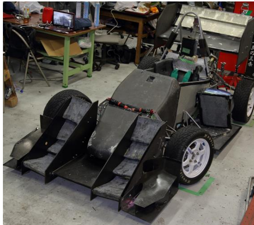
Fig.3 フロントウィングを取り付けた車両