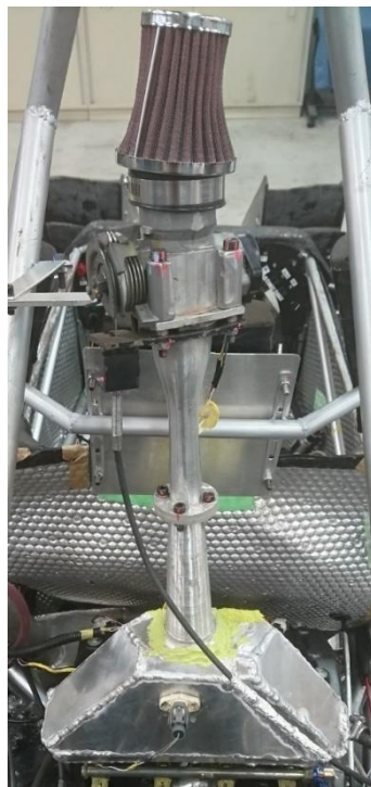
Fig.2 製作したインテーク

台風の上陸により安全を考慮し 10 月 22 日に予定していた試走を今回は見送ったため、今月製作したインテークを評価することは出来ませんでした。