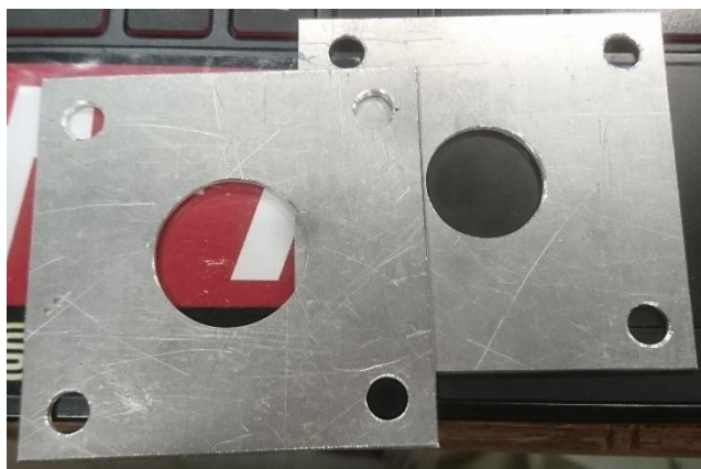
Fig. 3 製作したオリフィス

今後パワートレイン班でのパーツの性能評価をシャシーダイナモによって行っていく予定です。シャシーダイナモでは、オリフィスを用いて疑似的にスロットル径を変更し、設計に向けての裏付けをとっていきます。