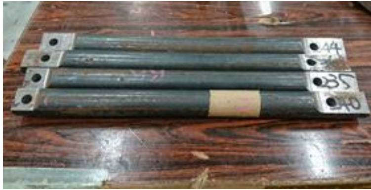
Fig. 5 接地時ダンパー長に合わせて製作したリジットダンパー