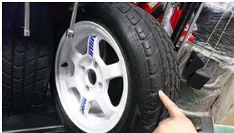
Fig. 4 履き替え後のレインタイヤ

レインタイヤに劣化が見られた為、新しく Hoosier の学生フォーミュラ用レインタイヤへの履き替えを行いました。