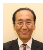
日比 一昭 津島市長