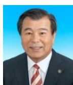
豊岡 武士 三島市長