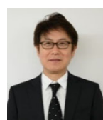
松木 正一郎 下田市長