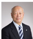
日置 敏明 郡上市長