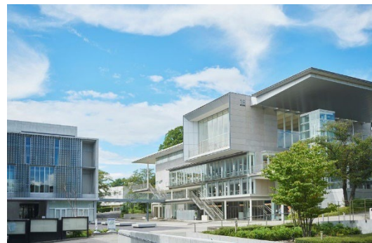
工学院大学八王子キャンパス