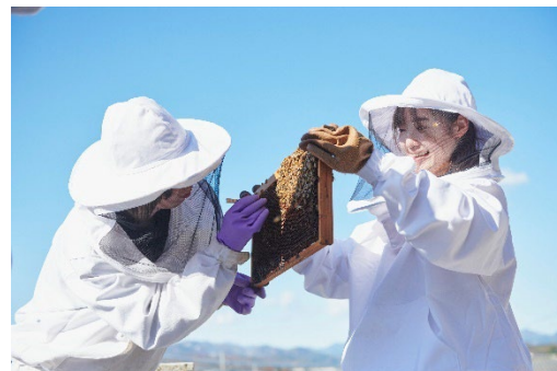
八王子キャンパスで養蜂

建学の理念「工の精神」のもと、工科系分野4学部15学科、160以上の研究室で行われる教育と研究を通じ、次世代を担うモノづくり人材「21世紀工手」を育成しています。