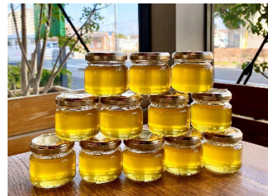
「26Kブルワリー」で学生たちがビールの醸造を体験(左・右上)、みつばちプロジェクトのハチミツ(右下)