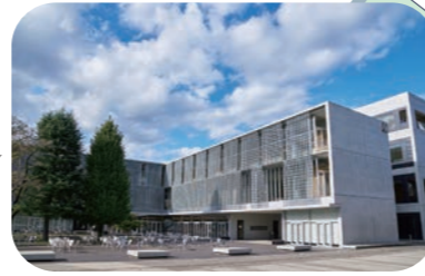
1号館 125周年記念総合教育棟