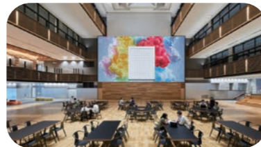
新宿キャンパス1階アトリウム