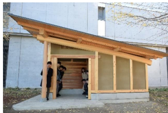
2 棟目:2018 年 11 月 30 日竣工