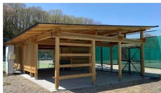
4 棟目:2022 年 4 月 9 日竣工