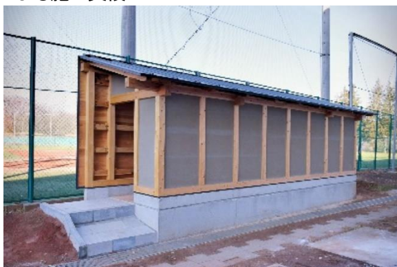
1 棟目:2017 年 12 月 20 日竣工