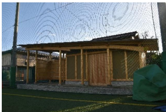
3 棟目:2019 年 12 月 18 日竣工