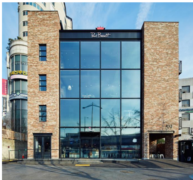
ポールバセットコーヒーステーションとして再生

元の建築はB1F~3Fをテナントと4Fを住居として使用。今回は1棟全てをコーヒーショップとし、「コーヒーステーション」と名づけ、ポールバセットというブランドを通してコーヒーにまつわる素晴らしい体験、「最高のカフェ体験」のできるショップとした。