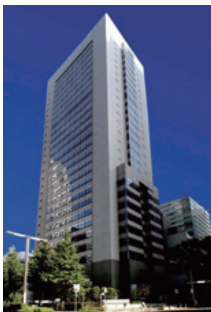
新宿キャンパス 高層棟外観