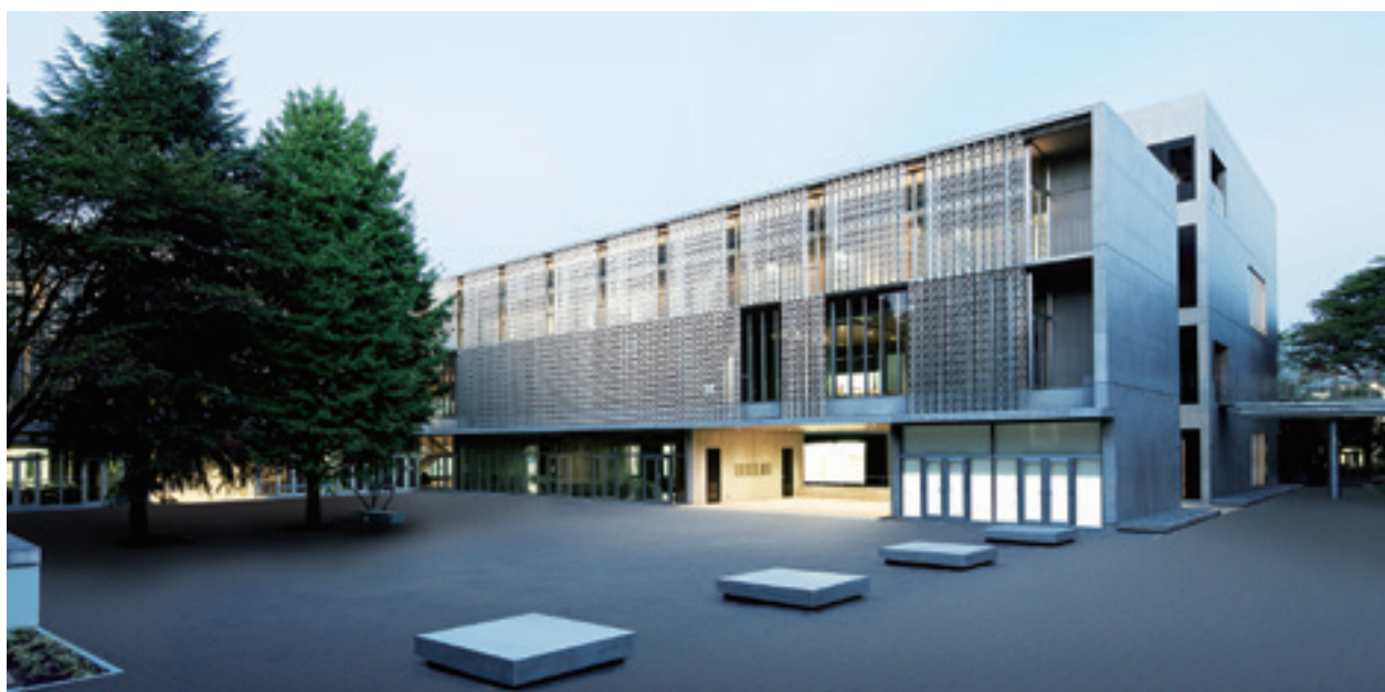
八王子キャンパス 1号館(125周年記念総合教育棟)外観