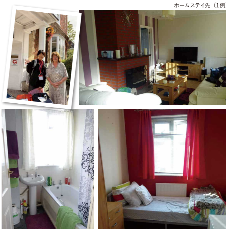
ホームステイ先 (1例)

留学中はできる限り多くの時間、生の英語に触れらうこと、現地在住者と生活を共に過ごすことによりイギリスの文化や風習を吸収してもらうこと、参加者の日々の安全確認等を考慮し、滞在期間全てを通してホームステイによる滞在となります。滞在するファミリーはブリティッシュカウンシルの厳格な選定基準をパスし、かつ現地提携校が選定したホストファミリーで、留学生の受け入れを積極的に行っているファミリーです。滞在中はファミリーにより、朝食および夕食の提供があります。ただし、食事はファミリーが作ってくれることもありますし、自分で作ることもあります。通学は公共のバスを利用します。