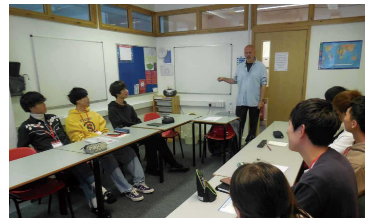
(上) 英語授業 (下) 日帰りバス旅行の様子