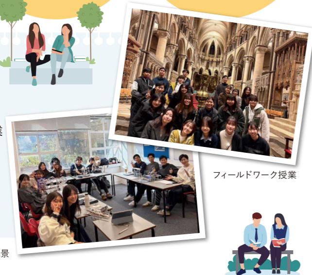
フィールドワーク授業