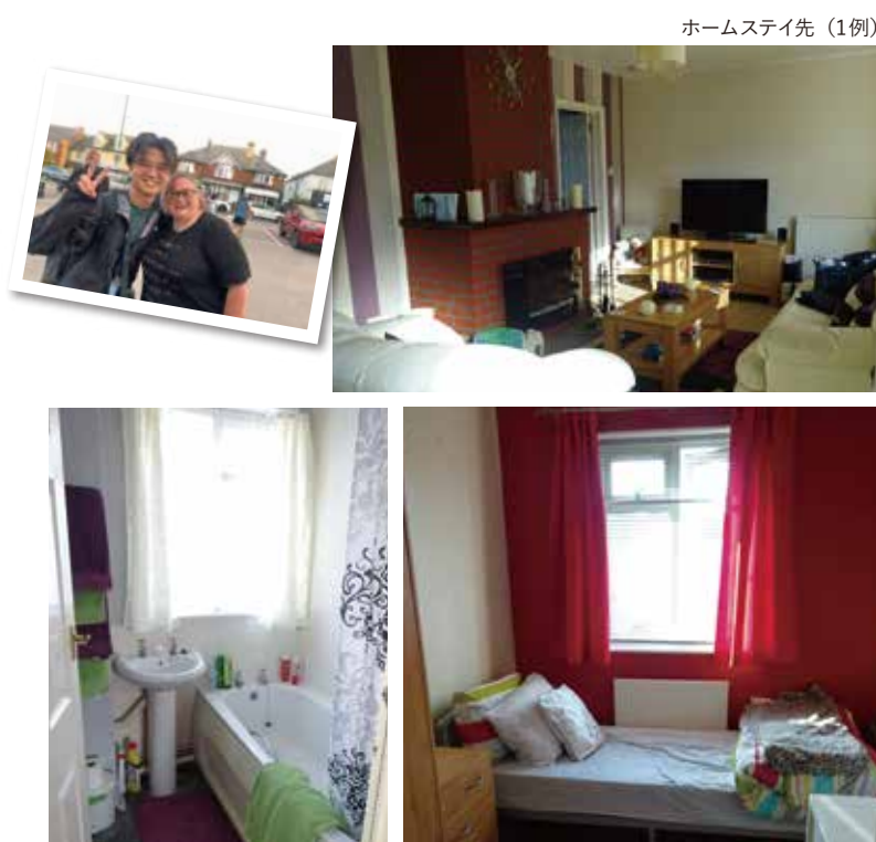
ホームステイ先（1例）

留学中はできる限り多くの時間、生の英語に触れらうこと、現地在住者と生活を共に過ごすことによりイギリスの文化や風習を吸収してもらうこと、参加者の日々の安全確認等を考慮し、滞在期間全てを通してホームステイによる滞在となります。滞在するファミリーはブリティッシュカウンシルの厳格な選定基準をパスし、かつ現地提携校が選定したホストファミリーで、留学生の受け入れを積極的に行っているファミリーです。滞在中はファミリーにより、朝食および夕食の提供があります。ただし、食事はファミリーが作ってくれることもありますし、自分で作ることもあります。通学は公共のバスを利用します。