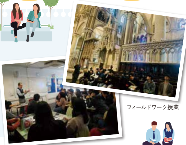
フィールドワーク授業