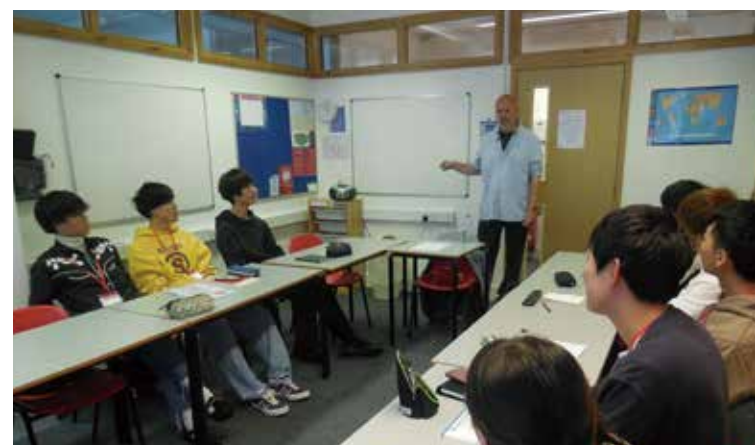
（上）英語授業 （下）日帰りバス旅行の様子