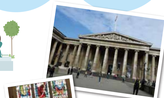
フィールドワーク授業