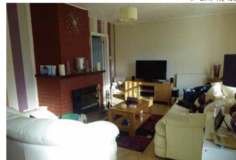
ホームステイ先 (1例)