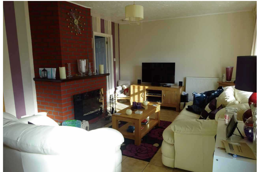
ホームステイ先 (1例)