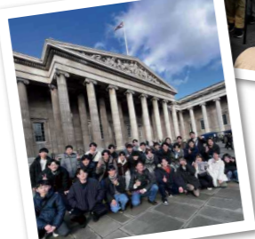
フィールドワーク授業